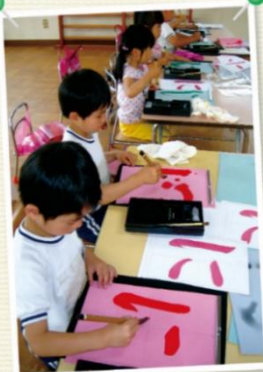
年1回級位認定があるから、 目標が立てやすい!