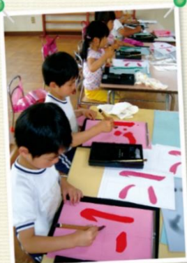
年1回級位認定があるから、 目標が立てやすい!